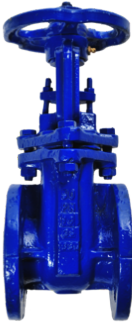
Fig. 012 / 30 PN 10