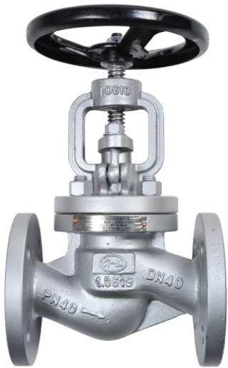
Fig. 125 / 222 PN40