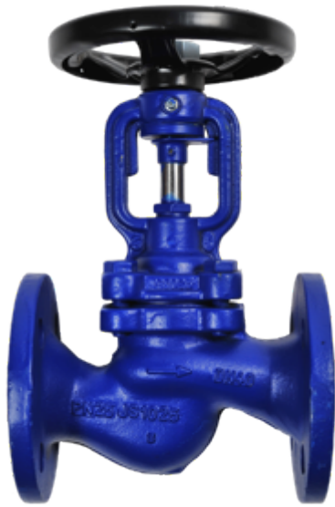
Fig. 102 / 220 PN16