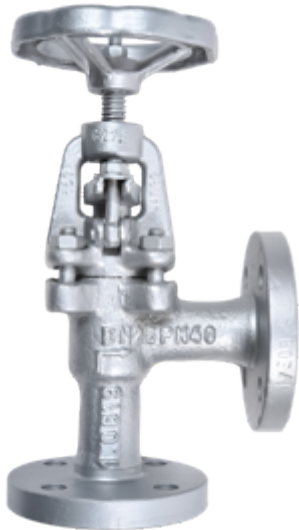
Fig. 124 / 221 PN40