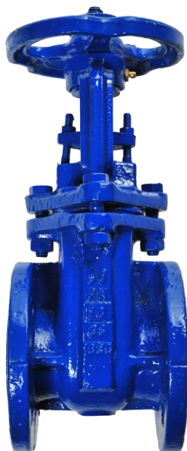
Fig. 012 / 30 PN 10