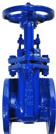
Fig. 014 / 24 PN10