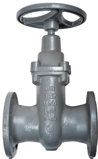
Fig. 020 / 32 PN16