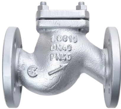
Fig. 261/651 PN40