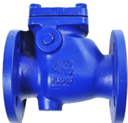
Fig. 400/614 PN16