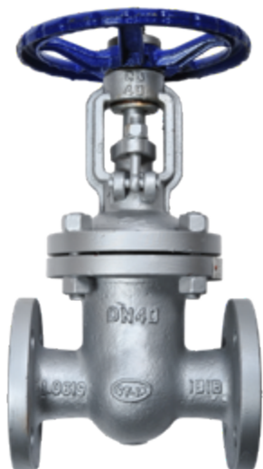
Fig. 032 / 75 PN25