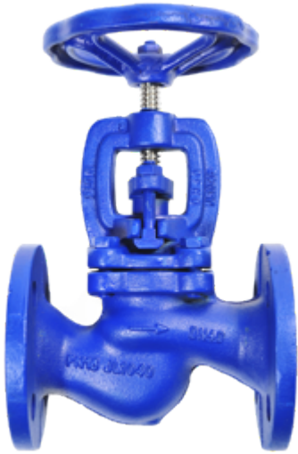
Fig. 101 / 216 PN16