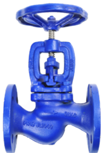
Fig. 103 / 210 PN16