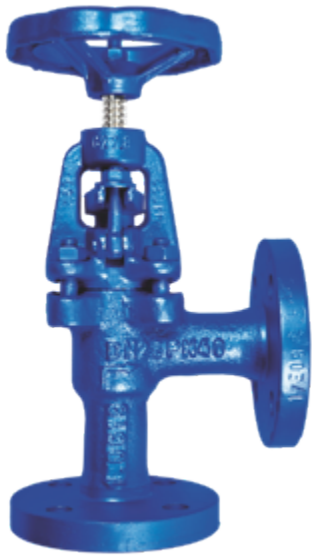
Fig. 106 / 213 PN16