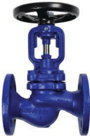
Fig. 107 / 219 PN25