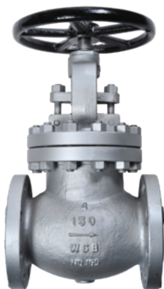
Fig. 130 / 238 PN20 ASA 150 lbs