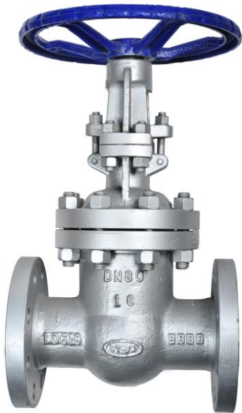
Fig. 030 / 72 PN25