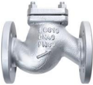
Fig. 262/652 PN63